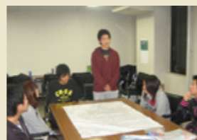
身近な話題で楽しく自己紹介