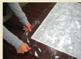
地図に透明シートをかぶせる